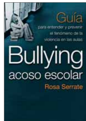
272 páginas Bullying. Acoso escolar Rosa Serrate