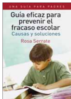
256 páginas Guía eficaz para prevenir el fracaso escolar Causas y soluciones Rosa Serrate